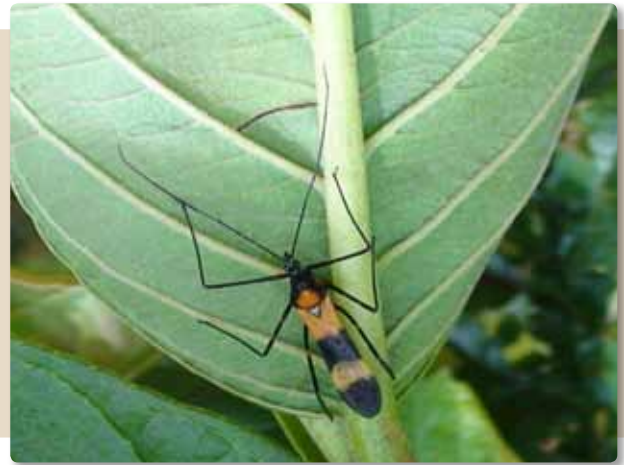
Figura 8. Adulto de Zelus vespiformis .