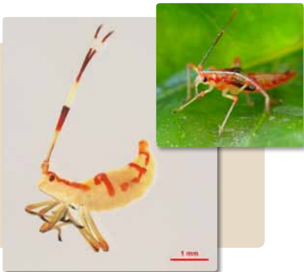
Figura 4. Ninfa de M. velezangeli .