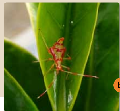
Figura 2. a. Ninfa de Reduviidae; b. Ninfa de M. velezangeli .