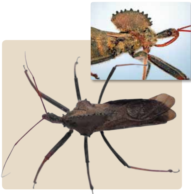
Figura 9. Adulto de Arilus sp.