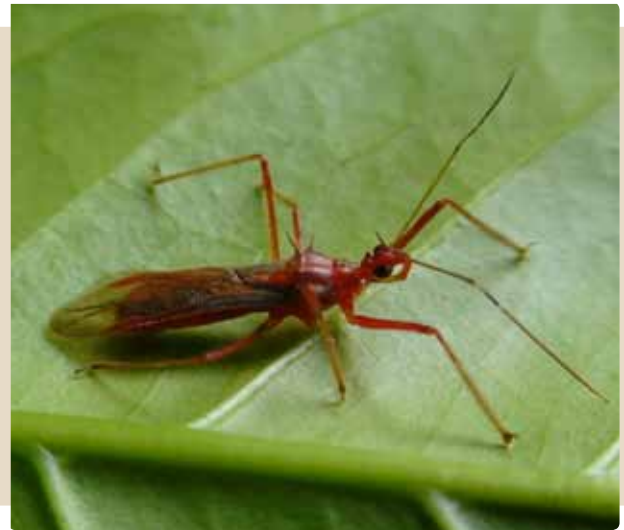
Figura 10. Adulto de Repipta sp.