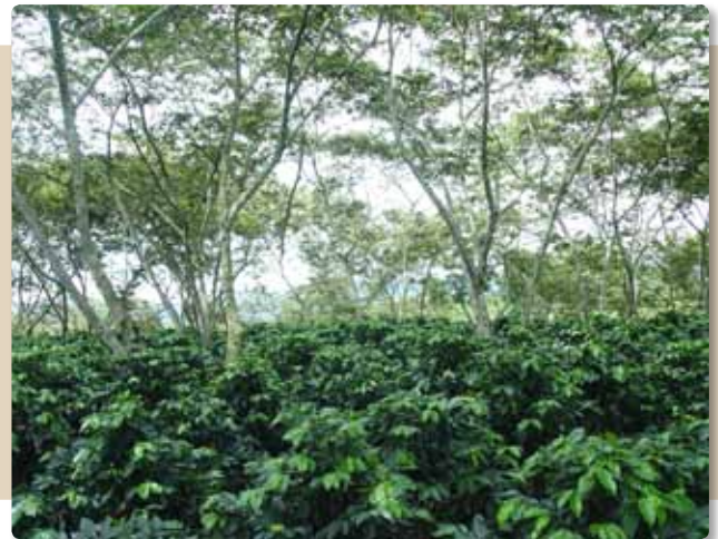
Figura 14. Panorámica de un cafetal con sombrío.

2. Las especies arbóreas o arvenses dentro del cafetal favorecen la presencia de estas chinches, ya que estas plantas suministran refugio (Figura 14) y posibles fuentes de alimento alterno.