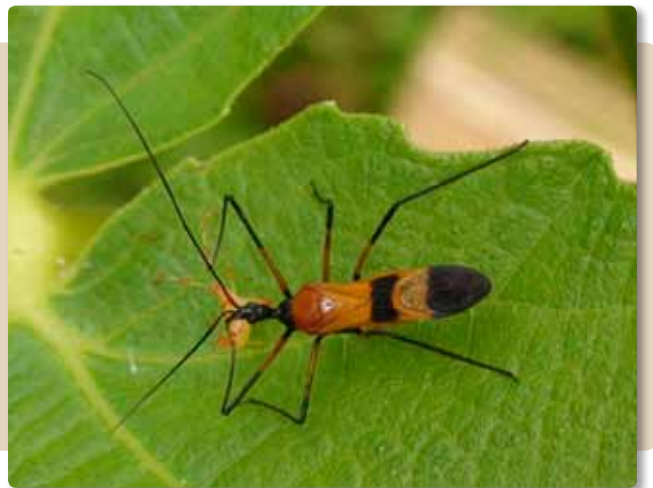
Figura 13. Adulto de Zelus vespiformis (Hemiptera: Reduviidae) depredando una ninfa de M. velezangeli (Hemiptera: Miridae).

La búsqueda de alimento se caracteriza por una localización visual (4) y captura de la presa con sus patas delanteras, las cuales no están cubiertas de espinas. En el caso del género Zelus sus especies cuentan con una sustancia pegajosa en las patas anteriores, que les sirve para capturar y sujetar a sus presas (25).