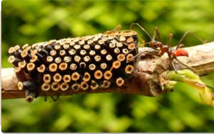
Figura 11. Postura, posiblemente, de Repipta sp. (Hemiptera: Reduviidae).