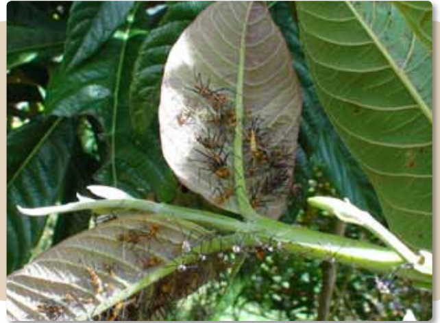
Figura 12. Colonia de Zelus vespiformis en guayaba.